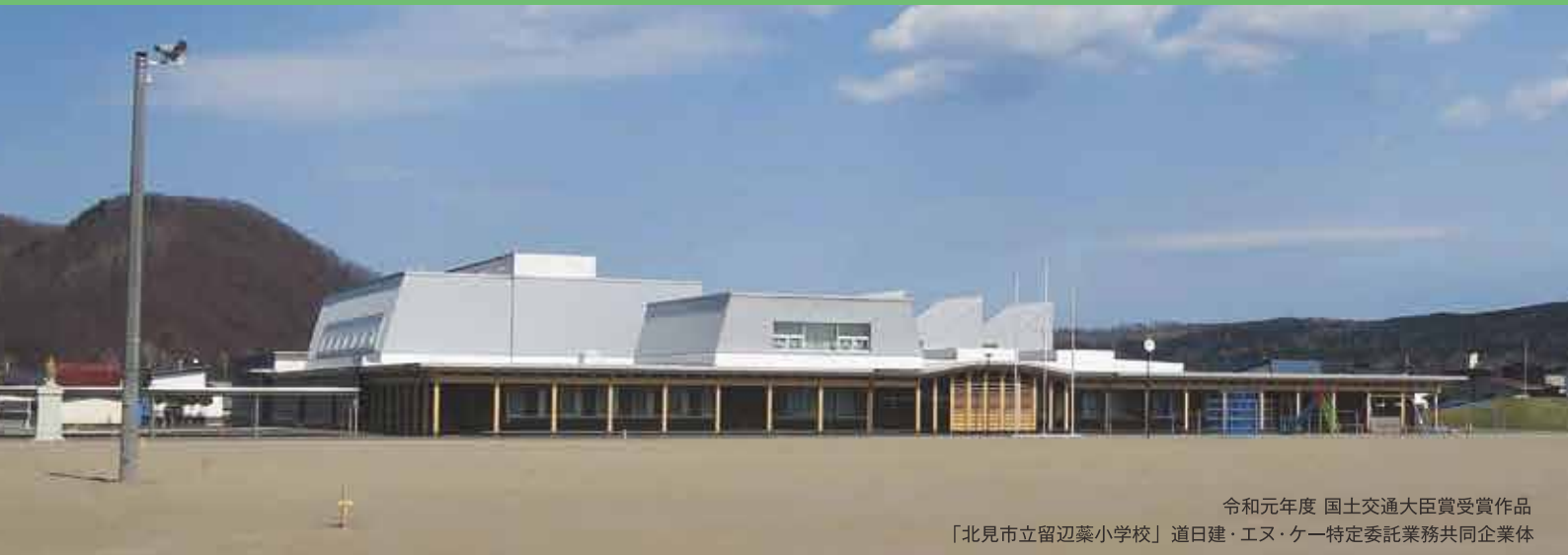
令和元年度 国土交通大臣賞受賞作品 「北見市立留辺蘂小学校」 道日建・エヌ・ケー特定委託業務共同企業体

建築士事務所協会の会員が対象ですが、会員でない方も、第1次審査で第2次審査候補作品に選考された後の入会を条件に応募いただけます。