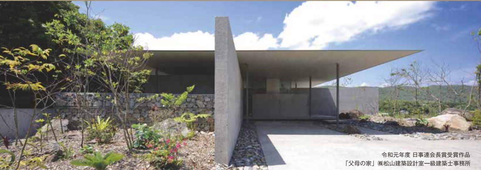
令和元年度 日事連会長賞受賞作品 「父母の家」 榊山建築設計室一級建築士事務所