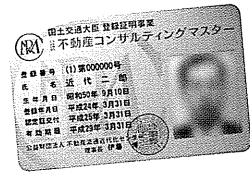
シルバーカード (初回認定、更新1回目の方)

※平成25年1月より「公認 不動産コンサルティング技能登録者」に替わる新名称として制定