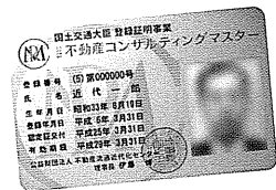
ゴールドカード (更新2回目以降の方)