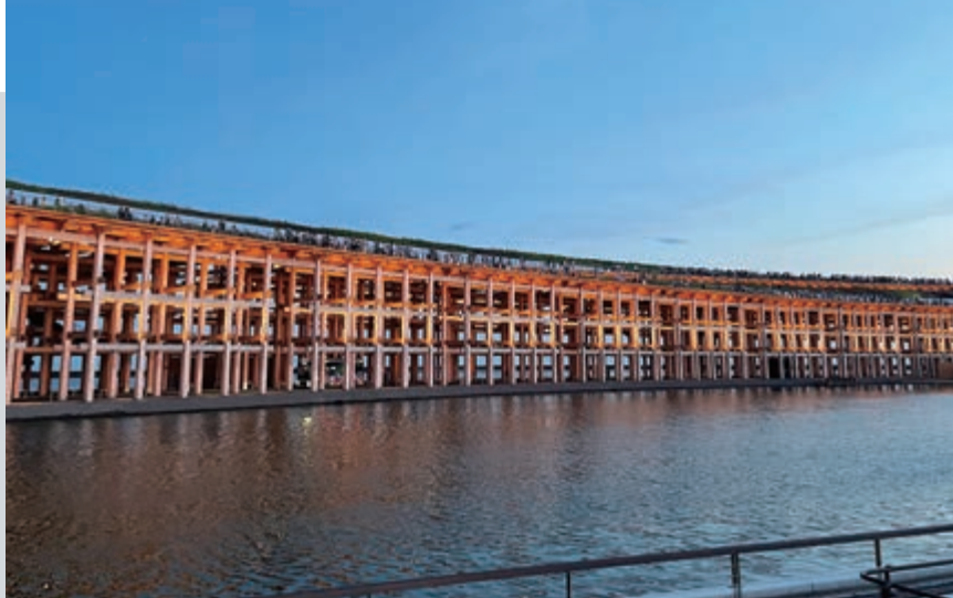
海と陸をつなぐ大屋根リング