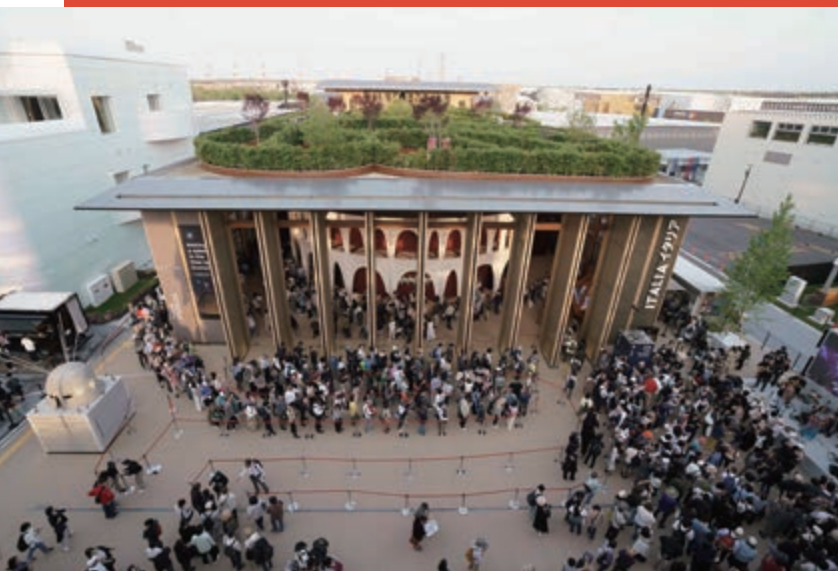
連日多くの人々が並んだイタリア館